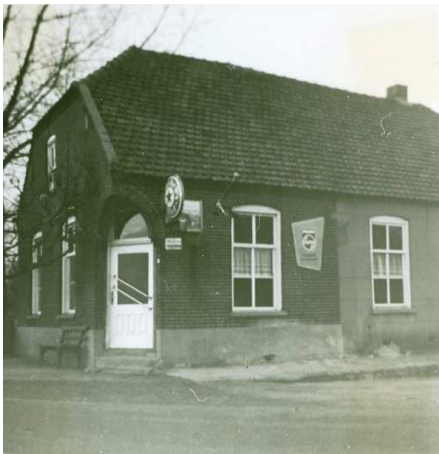
Café het Haasje.

Teefelen een paar koeien houdt. De middenstand houdt hier op de dijk op bij het café van Frans Wertenbroek . Zouden we verder gaan dan kwamen we uit in het volgende dorp, Kessel. We gaan dus even een stukje terug en gaan naar beneden via de Citadelstraat. Aan het einde daarvan is het loonbedrijf van Nat van Amstel gevestigd. Als we linksaf slaan op de hoofdweg, we zijn