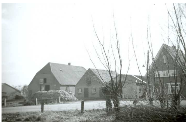
Busonderneming De Maaskant.

Het is 1951, een gewone doordeweekse dag. Het kleine dorpje Lith ligt er mooi bij, zo tussen de polders en de Maas. Als Theo thuis op de fiets stapt, ziet hij aan de overkant de busonderneming