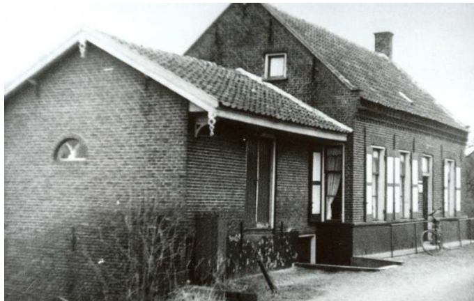
Café van Eldijk.