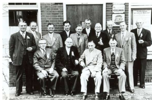
De Lithse Wielclub gefotografeerd voor Café Slijpen in 1956.