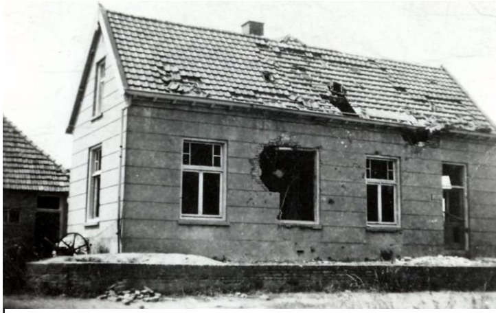
Het beschadigde pand van de familie De Werd na de oorlog.

Uiteindelijk kunnen ze een lokaal betrekken in het Lithoijense klooster, waar het betrekkelijk veilig is en waar de kinderen buiten kunnen spelen. Wanneer er twee weken later een bom valt in Lithoijen blijkt die te zijn neergekomen tegenover de bewuste boerderij, die volledig verwoest wordt. Het is de tweede keer dat het gezin ontsnapt blijkt te zijn aan de dood en het ontlokt Grad de opmerking: “Ze hebben daarboven niet alleen een vinger in de pap, maar een hele hand!” Zoiets verdient natuurlijk een dankgebedje. En wel twee ook!