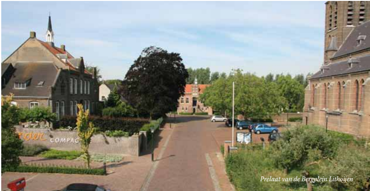
Prelaat van de Bergplein Lithoijen

het verleden na voltooiing van de Maaskanalisisatie in de jaren '30. Weinigen realiseren zich dat het grote stuw- en sluiscomplex, dat in de jaren 1932-1936 tot stand kwam, niet op het grondgebied van Lith lag, maar in de gemeente Lithoijen. Echte Lithoijnaren weten dat gelukkig nog!