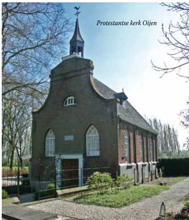
Protestantse kerk Oijen

hun kerkelijke plichten waren aangewezen op het Megense Teeffelen. Daar werd de kerk in de jaren 1657-1661 vernieuwd en vergroot tot de huidige omvang. Pas in 1712 kwam er in Oijen een schuurkerk, mogelijk aan de Vlierstraat ter hoogte van de veerstoep.