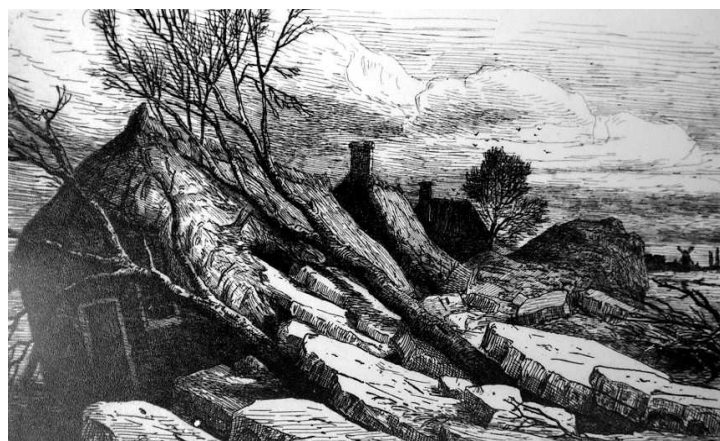
“....door het ijs omver gekrooijen”

“In het jaar 1871 de 6e februari tot pastoor benoemd heb ik de 11e februari possessie van de pastorie genomen, terwijl alles onder water stond, de dijken overliepen op verschillende punten tussen Empel en Gewande, op vele plaatsen de dijk met ijs bezet was. Verschillende huisjes onder Alem waren of geheel of gedeeltelijk door het ijs omver gekrooijen. Het water stond alsdan in de kelder der pastorie zo hoog dat men hetzelfde moest keren in de kelderdeur opdat de pastorie niet geheel zou onderlopen; des zondagsmorgens echter bij het ontwaken was de kwel overal doorgedrongen en stond de kerk ca. 2 voet en het huis ruim 1 voet onder water, hetwelk duurde tot ca. woensdagmiddag, wanneer het water weer genoegzaam verdwenen was in de pastorie”.