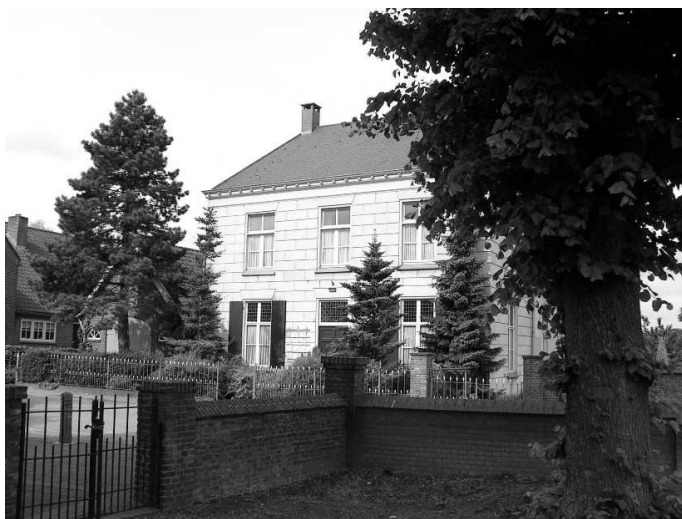
De pastorie in 2007

De volgende stap is de pastorie, die op dezelfde plek bijna opnieuw verrijst. Het terrein is ook hier opgehoogd en met de sloop van het oude schuurkerkje komen er bouwmaterialen vrij die weer gebruikt kunnen worden voor de pastorie. Het voorste gedeelte van de pastorie heeft exact dezelfde afmetingen als het schuurkerkje, waarvan de dakspanten nog geheel intact zijn. Die worden gebruikt voor het nieuwe dak van de pastorie. Prachtige schilderijen en religieuze spreuken in sierlijke letters blijven zo bewaard. Helaas zullen de balken en panelen ruim een eeuw later – bij een brand in 1983 - verloren gaan.