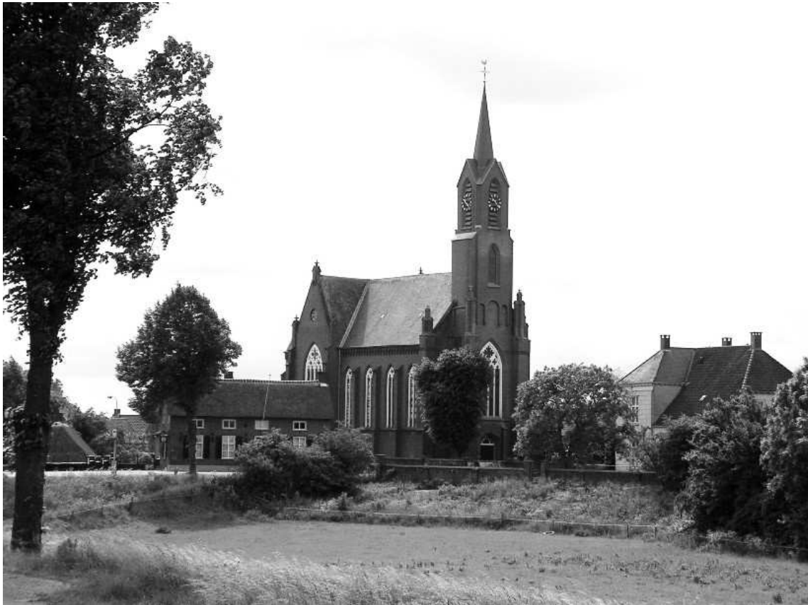
De kerk van Alem in 2006

overschreden. Voor dat geld is de kerk ook een kachel rijker, zodat de stoofjes, die sommige gelovigen op zondag meebrachten, voortaan thuis kunnen blijven. Al met al zijn er enorme verbeteringen aangebracht zowel aan de binnen- als aan de buitenkant, en kan de kerk er weer voor langere tijd tegen. Dit keer is het niet de tand des tijds maar de oorlog die herstelwerkzaamheden nodig maakt, zij het dat de kerk van Alem als één van de weinigen in de wijde omgeving gespaard blijft. De kerken met hun hoge torens, zijn zeer bruikbare uitkijkposten voor de Duitsers, maar als ze moeten terugtrekken doen ze veel succesvolle pogingen om hun uitkijkposten te vernietigen. In Alem wordt dat door de bevrijders nog net voorkomen, als ze de Duitsers op heterdaad betrappen bij het aanbrengen van springladingen.