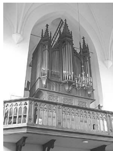
Het kerkorgel in 2004

In 1880 zijn er voldoende middelen om de gebroeders Gradussen uit Winssen een orgel te laten bouwen. Deze gebroeders leveren degelijk werk af; het nieuwe orgel is een sieraad voor de kerk. Het wordt aangedreven door een hefboom die op en neer bewogen dient te worden. De jongens uit de hoogste klassen van de lagere school beschouwen dit ‘pompen’ als een erekarweitje en vervullen bij toerbeurt deze taak. Na de tweede wereldoorlog zal het orgel elektrische aandrijving krijgen.