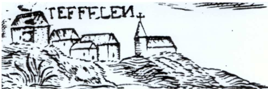
Teeffelen in 1699

Teeffelen kende een lange onderwijshistorie. Uit oude archiefstukken van het dekenaat Cuijk blijkt dat dit dorp in het begin van de zestiende eeuw reeds zijn eigen school had. Omstreeks 1510 is er sprake van vermelding van een schoolmeester te Teeffelen, Henricus Rumoldi genaamd.